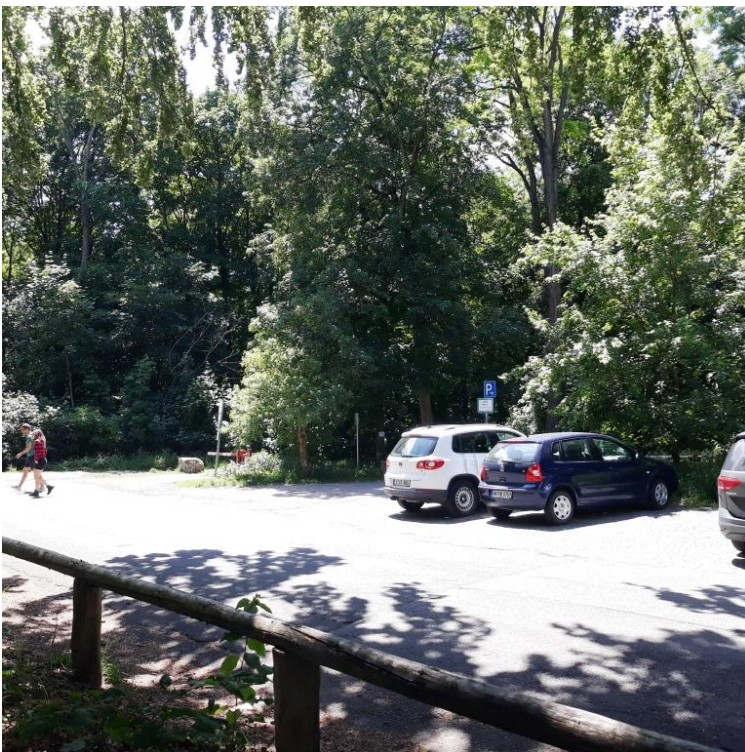
Sicht aus dem Innenbereich auf den Waldparkplatz Hasenbergsteige