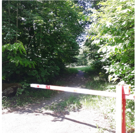
Sicht von der Hasenbergsteige aus